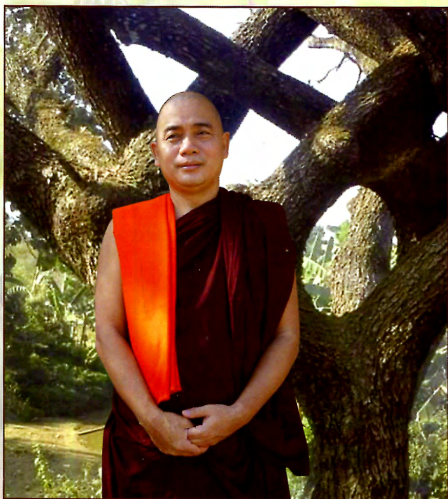
လစ်တံခါးဆရာတော် တက္ကသိုလ် ဗဟိုဌာန (ဖေဖာ)